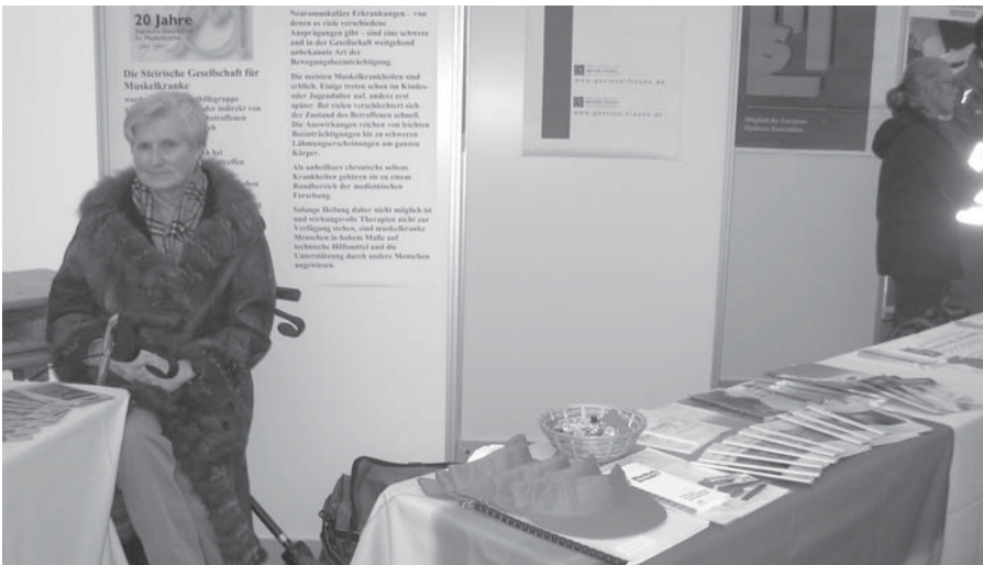
Unser Stand beim Selbsthilfetag 2009